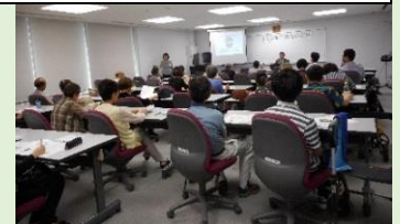
医療学習会（脊髄小脳変性症）