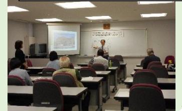
医療学習会（間質性肺炎）

【間質性肺炎学習会～相談員 memo～】 医師による例え話を交えた丁寧な説明は大変分かり易く、肺胞をぶどうに見立てた説明が印象的でした。また、間質性肺炎の患者さんに適した呼吸で心臓に負担をかけない方法や、病院受診を継続する必要性については、継続的に病状観察することで、急変への迅速な対応が可能となり、悪化予防ができるとアドバイスいただきました。