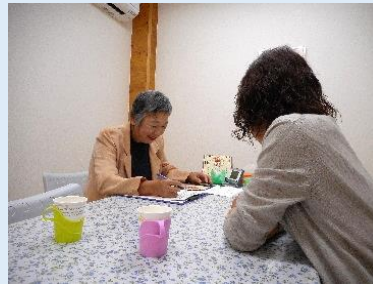
ピアカウンセリングの様子

*ピア(peer)とは、仲間という意味です。 同じ立場で悩みや思いをお聞きます。 実際にピアカウンセリングを受けた患者さんからは、「同じ病気の患者同士だったので、分かってもらえる部分が多くうれしかった。何の気兼ねもなく話せました。」等の感想もいただいています。 お気軽にお問い合わせください。