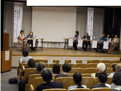
第21回難病セミナー

*ピア(peer)とは、仲間という意味です。 同じ立場で悩みや思いをお聞きます。 実際にピアカウンセリングを受けた患者さんからは、「同じ病気の患者同士だったので、分かってもらえる部分が多くうれしかった。何の気兼ねもなく話せました。」等の感想もいただいています。 お気軽にお問い合わせください。